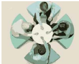
GESTION DEL CONOCIMIENTO